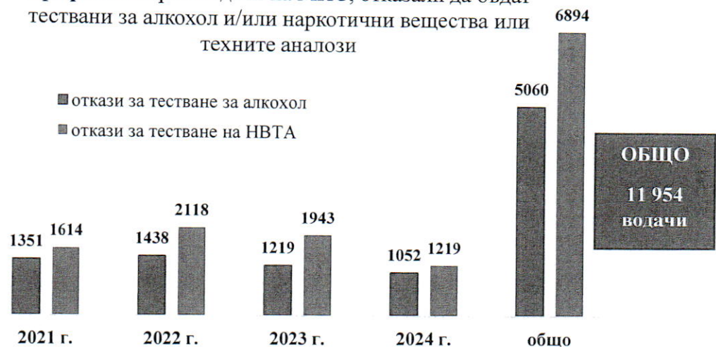
Графика 1. Брой водачи на МПС, отказали да бъдат тествани за алкохол и/или наркотични вещества или техните аналози

Същевременно след приетите от 49-тото Народно събрание, във второто полугодие на 2023 г., промени в Наказателния кодекс в разпоредбата на ал. 6 на чл. 343б (ДВ, бр. 67 от 4 август 2023г.), с които бе инкриминиран отказа за извършване на проверка по надлежния ред за установяване на употребата на алкохол и/или наркотични вещества или техни аналози при управление на моторно превозно средство, след като деецът е бил наказван за някое от тези деяния по административен ред, до края на 2023 г. са били образувани 34 досъдебни производства за такъв повторен отказ , а през 2024 г. – 196 досъдебни производства.