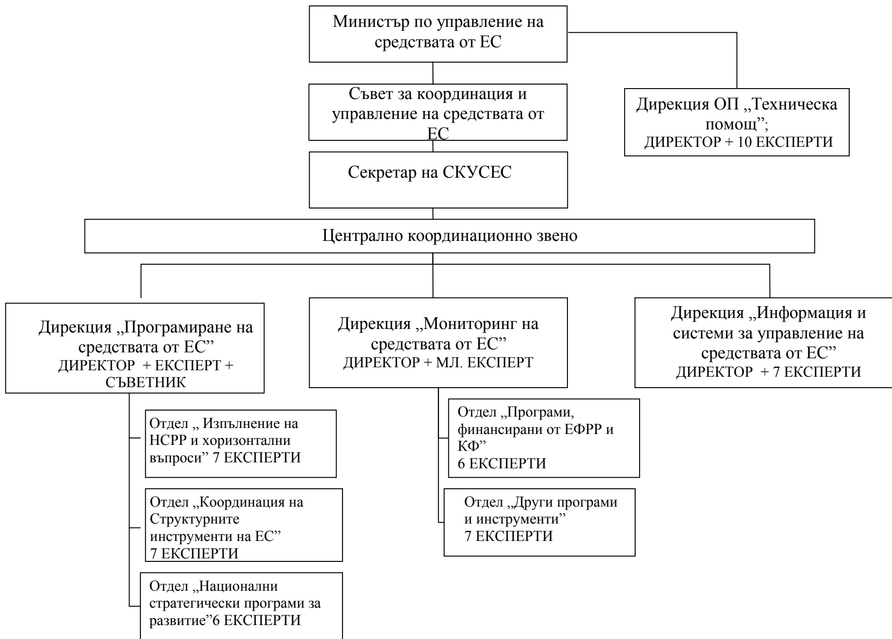
Схема № 1 Органиграма на изградената структура за координация в МС